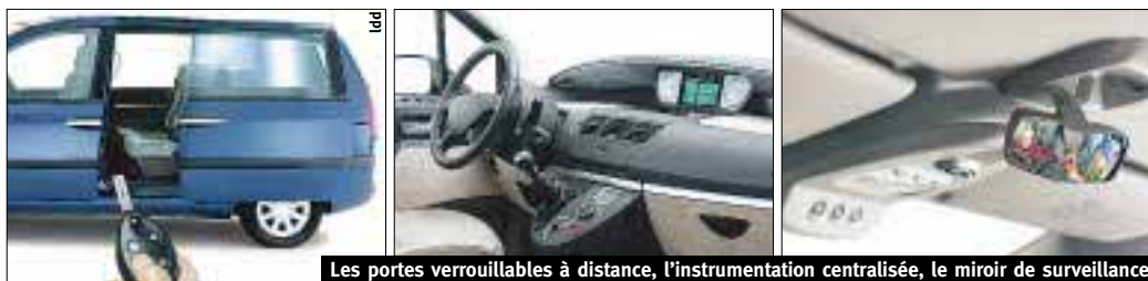
Les portes verrouillables à distance, l'instrumentation centralisée, le miroir de surveillance.