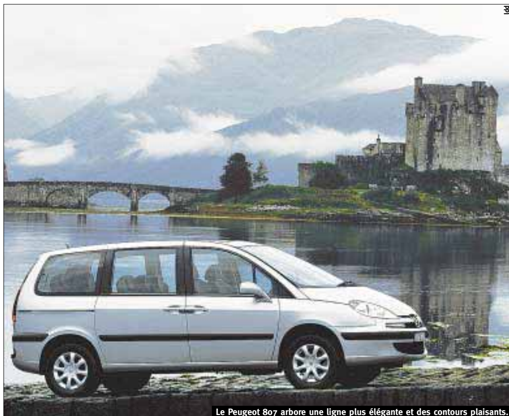
Le Peugeot 807 arbore une ligne plus élégante et des contours plaisants.